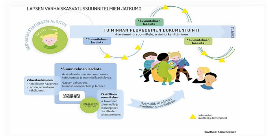
Kuvio 2. Lapsen vasun prosessikuva (OPH)

Varhaiskasvatuksessa olevalla lapsella on varhaiskasvatusturva oikeus saada suunnitelmallista ja tavoitteellista kasvatusta, opetusta ja hoitoa. Näiden toteuttamiseksi laaditaan jokaiselle päiväkodissa ja perhepäivähoidossa olevalle lapselle varhaiskasvatussuunnitelma. 6